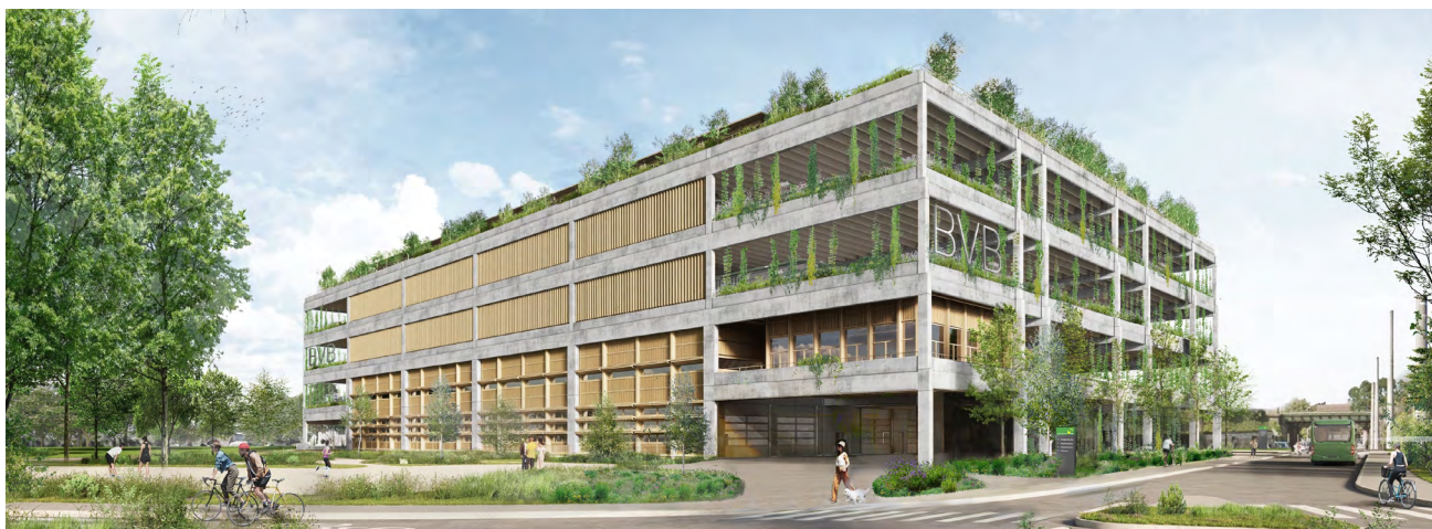
Abb. 1: Visualisierung Neubau Garage Rank. © Itten+Brechbühl AG

Die aktuelle Busflotte der BVB besteht aus je rund 60 Dieselnissen und batterieelektrischen Bussen (E-Busse). Die BVB plant, die gesamte Flotte bis 2027 zu modernisieren und komplett auf E-Busse umzustellen. Dadurch wird auch die gesetzliche Vorgabe erfüllt, dass der öV im Kanton Basel-Stadt bis 2027 mit 100 Prozent erneuerbarer Energie betrieben werden muss. Diese Systemumstellung bedingt auch den Neubau der Garage Rank.