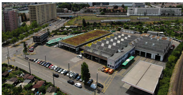
Abb. 2: Die ehemalige Garage Rank im Jahr 2023.

Die Garage Rank war seit Jahren der einzige Standort für die Instandhaltung und das Abstellen der BVB-Busse. Ihre ältesten Gebäudeteile stammten aus dem Jahr 1957, in den 1970er-Jahren wurde die Garage erweitert. Sie entsprach baulich und technisch nicht mehr den heutigen Anforderungen. So hätte sie beispielsweise erdbebenertüchtigt werden müssen. Zudem